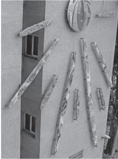
圖 9 工藝設計學系師生創作，〈臺藝之光·煦若陽春〉局部之一，陶土、彩釉、不鏽鋼，300×1500 cm，2009，國立臺灣藝術大學工藝大樓牆面。