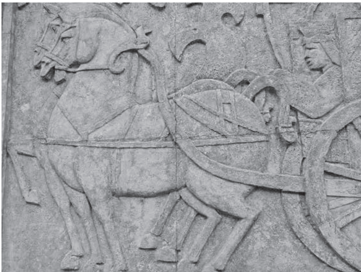
圖 4 雕塑科師生創作，〈孔子問禮於老子〉局部之二，水泥上色，706×304 cm，1969，國立臺灣藝術大學版畫藝術研究所右側。