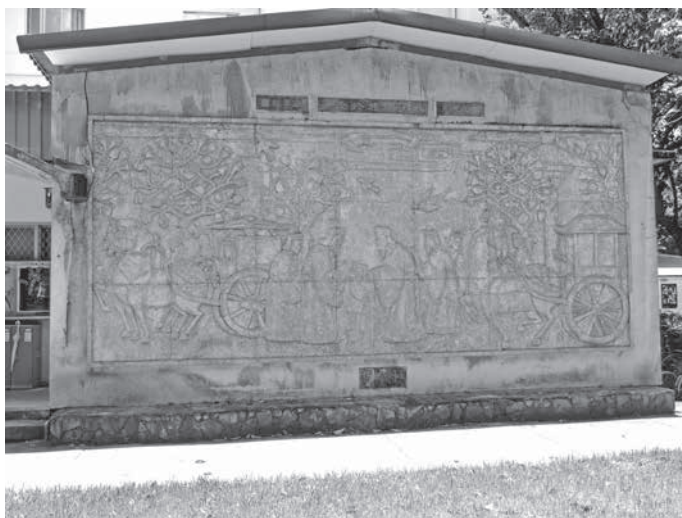
圖 2 雕塑科師生創作，〈孔子問禮於老子〉，水泥上色，706×304 cm，1969，國立臺灣藝術大學版畫藝術研究所右側。