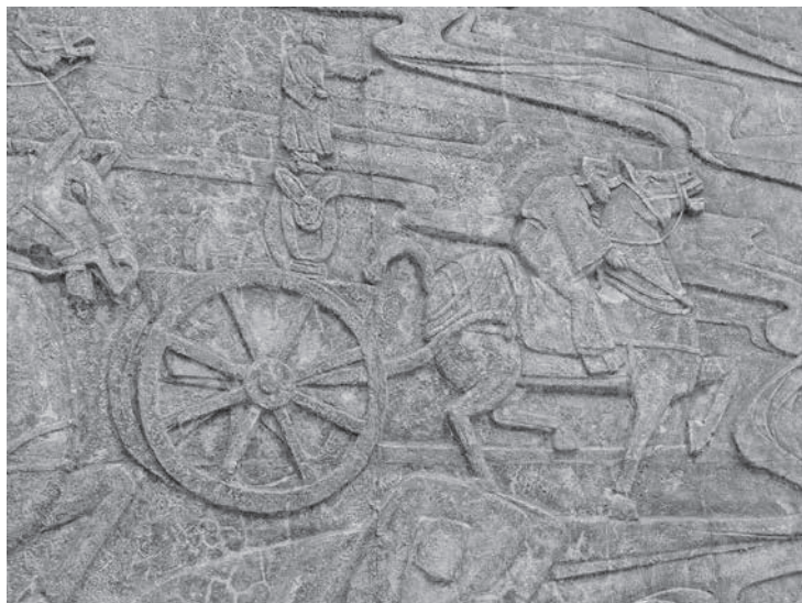
圖 7 雕塑科師生創作，〈黃帝發明指南車〉局部之二，水泥上色，706×304 cm，1969，國立臺灣藝術大學版畫藝術研究所左側。