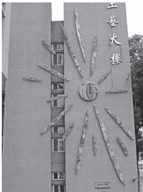
圖 8 工藝設計學系師生創作，〈臺藝之光·煦若陽春〉，陶土、彩釉、不鏽鋼，300×1500 cm，2009，國立臺灣藝術大學工藝大樓牆面。