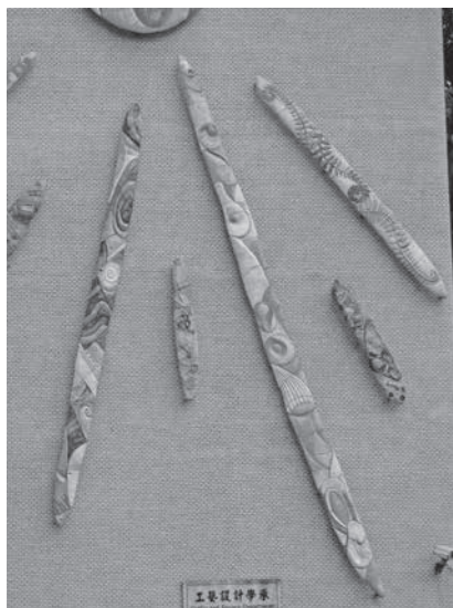
圖 13 工藝設計學系師生創作，〈臺藝之光·煦若陽春〉局部之四，陶土、彩釉、不鏽鋼，300×1500 cm，2009，國立臺灣藝術大學工藝大樓牆面。