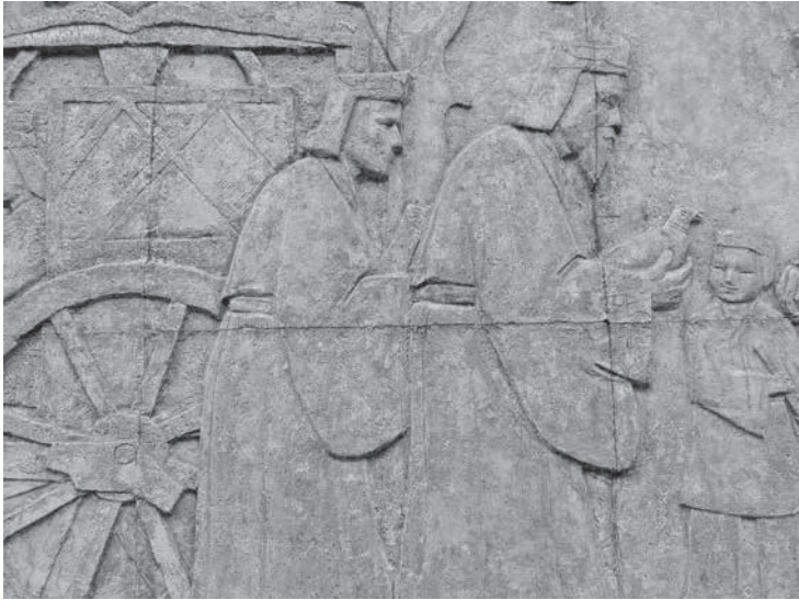
圖 3 雕塑科師生創作，〈孔子問禮於老子〉局部之一，水泥上色，706×304 cm，1969，國立臺灣藝術大學版畫藝術研究所右側。