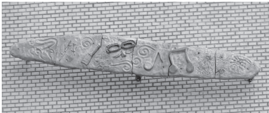
圖 11 工藝設計學系師生創作，〈臺藝之光·煦若陽春〉局部之二，陶土、彩釉、不鏽鋼，300×1500 cm，2009，國立臺灣藝術大學工藝大樓牆面。