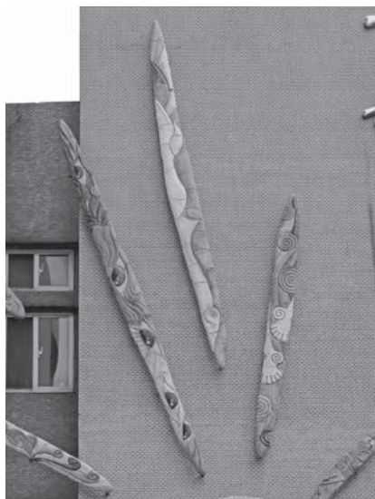
圖 12 工藝設計學系師生創作，〈臺藝之光·煦若陽春〉局部之三，陶土、彩釉、不鏽鋼，300×1500 cm，2009，國立臺灣藝術大學工藝大樓牆面。