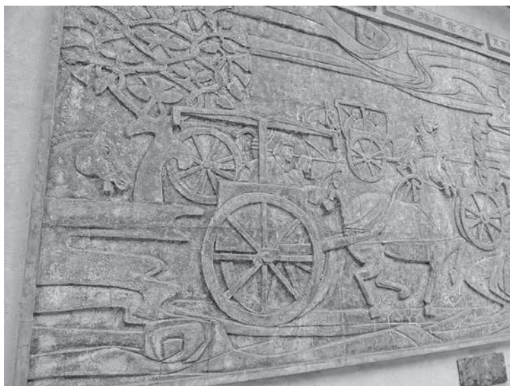
圖 6 雕塑科師生創作，〈黃帝發明指南車〉局部之一，水泥上色， 706×304 cm，1969，國立臺灣藝術大學版畫藝術研究所左側。