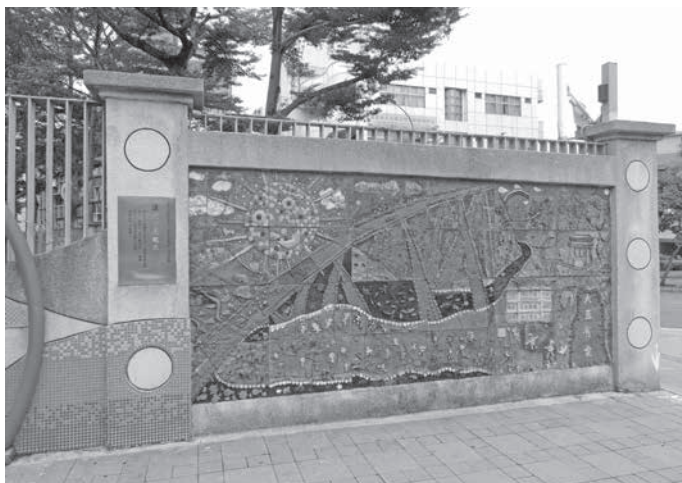
圖 1 臺北市大直國小第 51 屆畢業班師生製作，李昀珊指導，〈讓老牆亮起來〉，臺北市大直國小外牆。