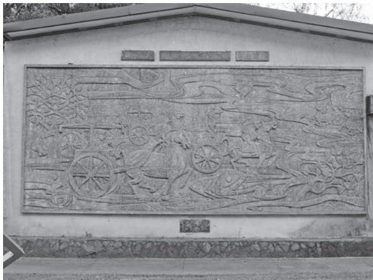
圖 5 雕塑科師生創作，〈黃帝發明指南車〉，水泥上色， 706×304cm，1969，國立臺灣藝術大學版畫藝術研究所左側。