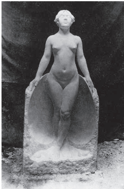
圖 2 黃土水·〈甘露水〉，大理石雕，尺寸不詳，1919。