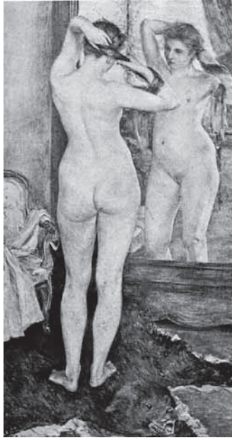
圖 1 黑田清輝·〈朝妝〉·原作燒毀，此圖爲《アトリエ》1：10（1924）的卷首彩頁，178.5×98 cm。

圖片來源：山梨繪美子編，《裸婦—素晴らしき日本女性の美》，東京：平凡社，2009，頁 15。