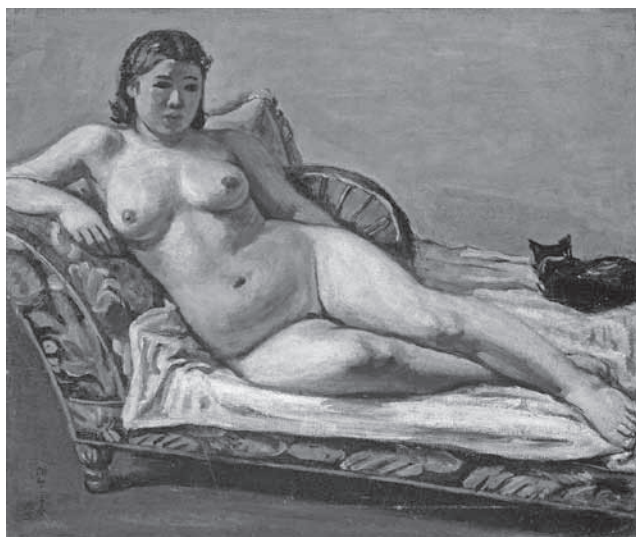
圖 10 李石樵，〈橫臥裸婦〉，油彩畫布，72.5×61.5 cm，1936。