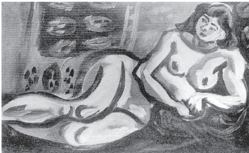
圖 7 梅原龍三郎，〈裸婦圖〉，材質不詳，尺寸不詳，1936 年第十回臺展。