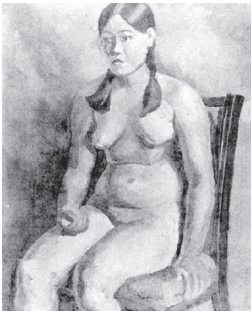
圖3 陳慧坤，〈裸體習作（其之二）〉，材質不詳，尺寸不詳，1930年第四回臺展。