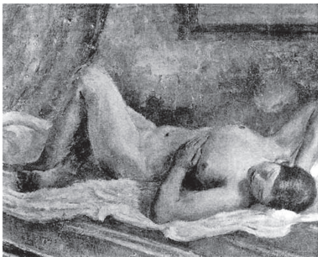
圖4 山田新吉，〈裸女〉，材質不詳，尺寸不詳，1930年第四回臺展。