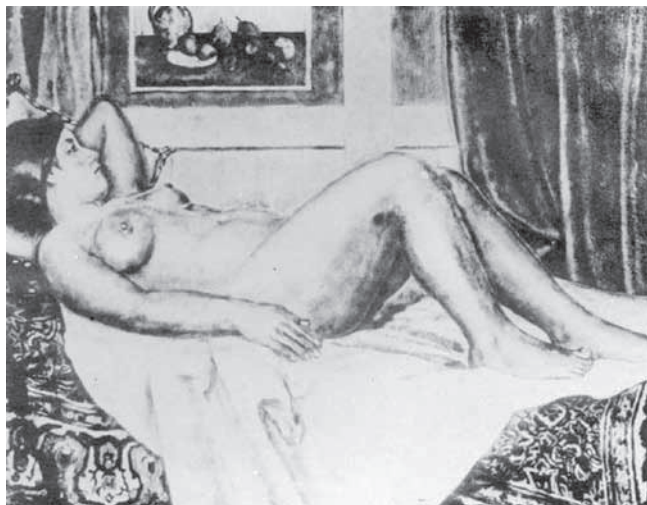
圖 11 吉川義光，〈アトリエの裸婦〉，材質不詳，尺寸不詳，1929 年第三回臺展。