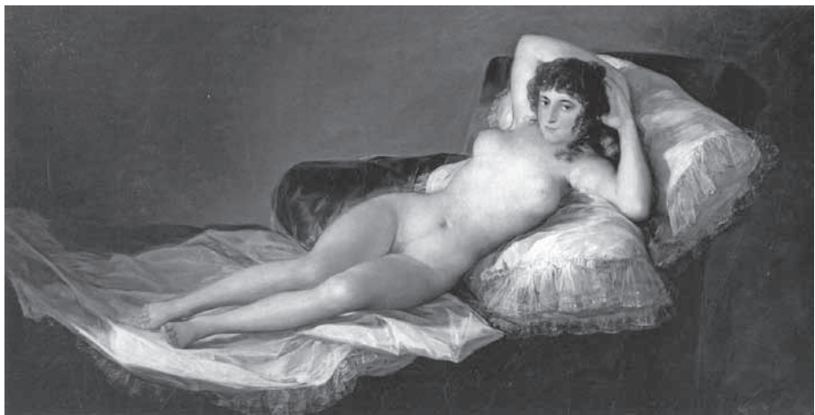
圖 6 哥雅·〈裸體的瑪哈〉，油彩畫布，97×190 cm，1798-1805。