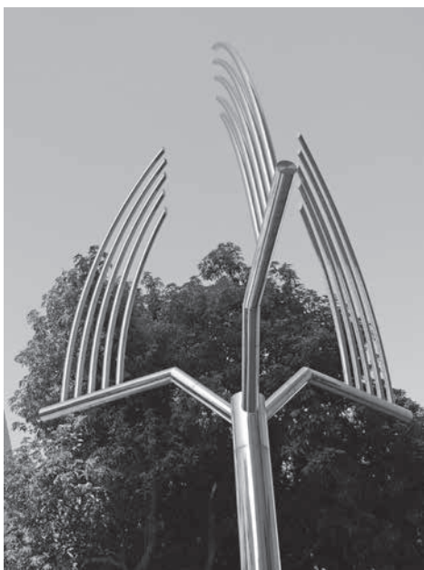
圖 6 松本薰，〈風的預感 cycle-90° (Wind Premonition Cycle-90°)〉之一，316 不鏽鋼，710×300×300 cm，2012，國立臺灣藝術大學校園內。