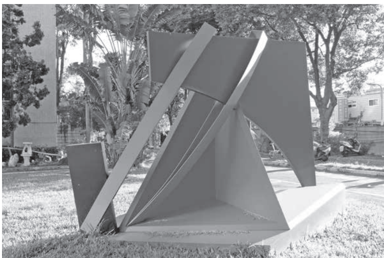
圖 4 菲利浦·金，〈Just so, Blue Deep (就是如此·深藍)〉之一，不鏽鋼， 316 \times 238 \times 258 cm，2012，國立臺灣藝術大學校園內。