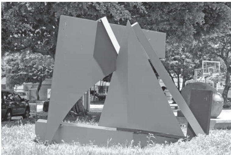
圖 5 菲利浦·金，〈Just so, Blue Deep (就是如此·深藍)〉之二，不鏽鋼，316×238×258 cm，2012，國立臺灣藝術大學校園內。