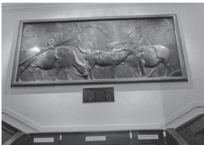
圖 1 黃土水，〈水牛群像〉，石膏淺浮雕，250×500 cm，1930，臺北市中山堂。