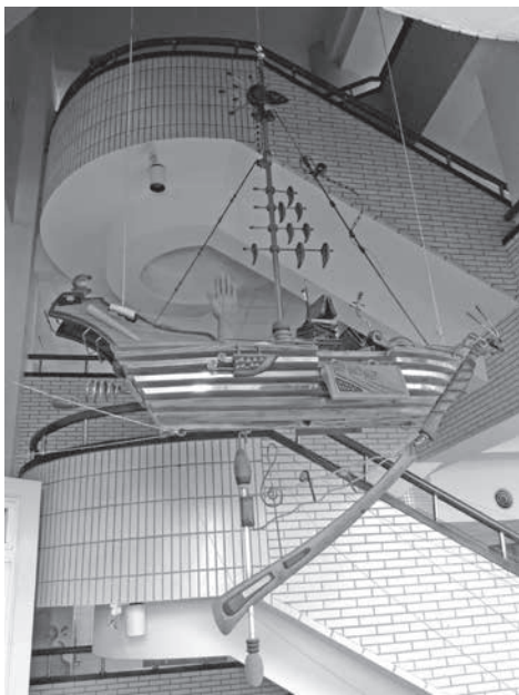
圖 3 甘信一，〈藝軍啓航〉，複合媒材， 300 \times 200 \times 110 cm，2005，國立臺灣藝術大學教學研究大樓內。